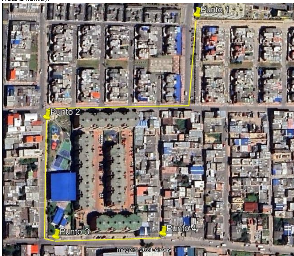
Ilustración 1. Recorrido verificación ambiental

Con base en lo anterior, el día 20 de noviembre de 2024 se realizó recorrido de control y vigilancia en el barrio Hato Segundo Sector desde las coordenadas 4°42'34,32"N- 74°11'57,762"W hasta las coordenadas 4°42'26,184"N- 74°11'55,182"W (ver ilustración 1. Ruta amarilla).